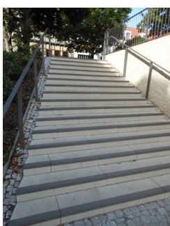
Treppe zur Mikwe