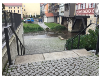
Weg mit Stufen zur Mikwe