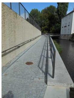
Rampenweg zur Mikwe

Über die Rampe sind zu erreichen: Eingangsbereich , Wege außen zum Plateau mit Schaufenster und Treppe zur Mikwe