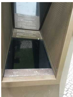
Schaufenster in die Mikwe