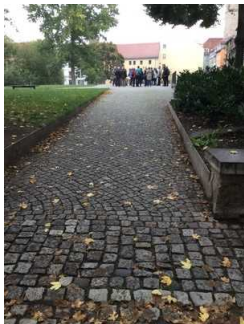
Weg außen zur Mikwe und Plateau