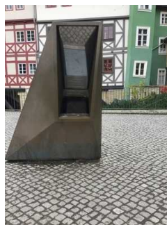
Schaufenster in die Mikwe

Auf folgende zu nutzende Wege wird hingewiesen: Wege außen zum Plateau mit Schaufenster und Treppe zur Mikwe